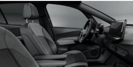
Notranjost Style "Plus" platinasto siva/temno siva Električno nastavljiva sedeža za maksimalno udobje