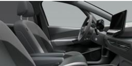
Notranjost Style platinasto siva/temno siva Pusti pečat z edinstvenim dizajnom