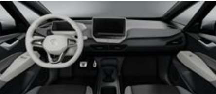
Notranjost temno siva/električno bela