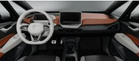
Notranjost žafranovo oranžna/električno bela 1