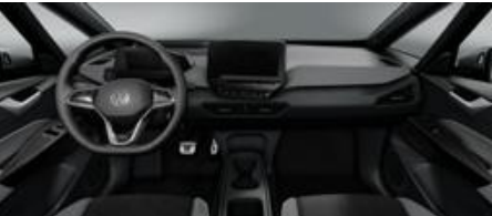
Notranjost temno siva/Piano Black