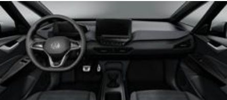
Notranjost platinasto siva/Piano Black