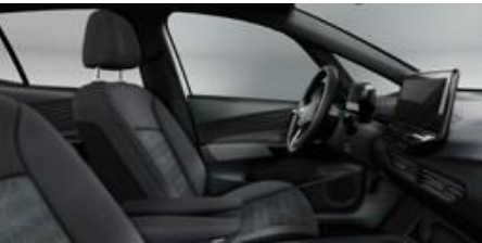
Standardni sedež platinasto siva/soul