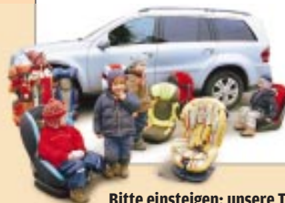
Bitte einsteigen: unsere Tester neben dem Mercedes GL

Es gibt aber noch andere Hürden beim Anschnallen der Kleinen: Im Polster versenkte Gurtschlösser zum Beispiel, wie in Audi A6 oder Saab 9-5. Steht der Kindersitz drauf, kommen selbst filigrane Damenfinger kaum